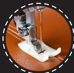
5 mm LEDER