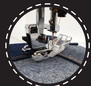
6 mm JEANS