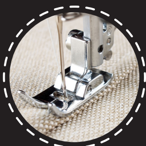
6 mm CANVAS