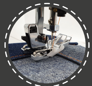
6 mm JEANS